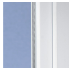
Klassisches Design mit weicher Kontur

Mit modernen Kunststofffenstern aus VEKA Profilen gewinnt jedes Haus. Denn das klassische Design des SOFTLINE Systems mit der leicht abgerundeten Kontur ist zeitlos und harmonisiert hervorragend mit unterschiedlichsten Architekturstilen – ob modern oder traditionell, ob Neubau oder Renovierung.