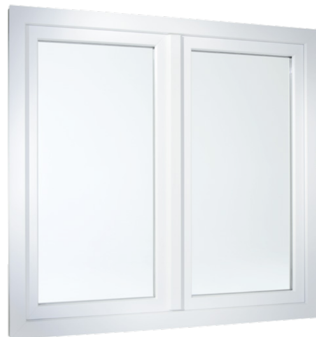
2-flügeliges Fenster in flächenversetzter Variante